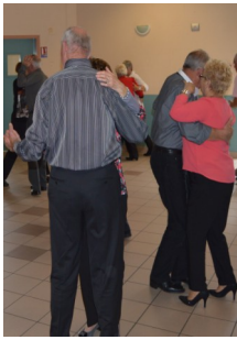
Danse avec les stars