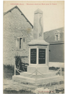
Le monument aux morts de Bouafles

Les enfants ont reçu un certificat de citoyenneté en récompense de leur civisme.